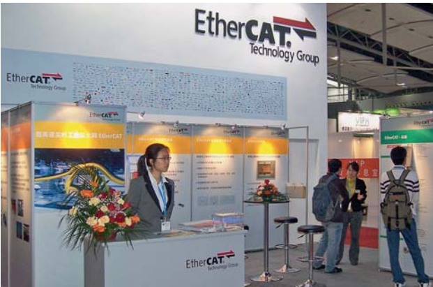
SIAF in Guangzhou

EtherCAT benötigt keine Switches. Der Master wird in Software auf Standard-Ethernet-Ports implementiert. Für Slave-Geräte stehen kostengünstige Chips zur Verfügung. Damit eignet sich EtherCAT hervorragend für geräteinterne („Embedded“) Anwendungen, bei denen CAN oder serielle Schnittstellen an ihre Leistungsgrenzen stoßen. Die ETG stellte auf der Embedded World in Nürnberg aus und traf dort auf großes Interesse: neben vielen neuen Kunden besuchten auch einige Entwickler von ETG-Mitgliedern den Stand und nutzten die Gelegenheit zum Fachgespräch mit den EtherCAT-Experten.