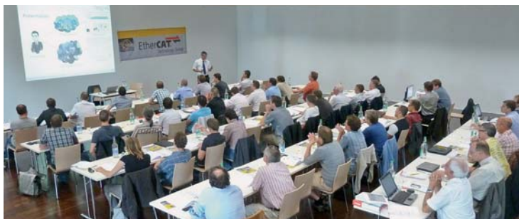
Die ETG-Roadshows in Großbritannien (oben) und der Schweiz (unten)