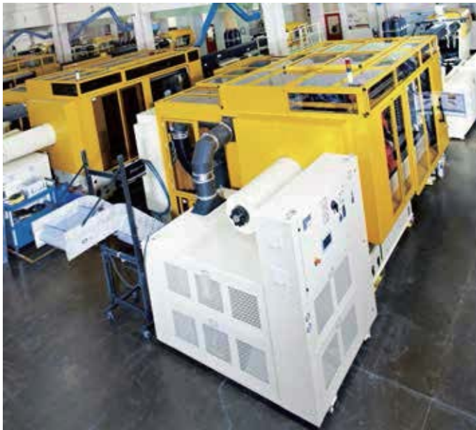
HyPET® HPP5 成功地建立在 HyPET® 平台的成熟技术上。添加更多功能可以帮助最终用户降低其总生产成本，同时确保最佳的瓶坯质量

赫斯基不仅使用先进的基于 PC 的控制系统：自 2006 年起，它就采用了 Beckhoff 开发的 EtherCAT 工业以太网通讯系统。“EtherCAT 和 TwinCAT 软件合作，可为赫斯基提供各种诊断工具，准确地指出设备