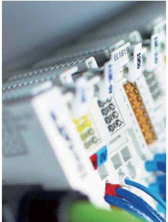
EtherCAT 端子模块系统也让赫斯基能够实施先进的 I/O 功能，如电力测量

赫斯基通过使用 Beckhoff 基于 EtherCAT 的 XFC 极速控制技术进一步提升了性能。“具有超采样功能的 XFC 端子模块 EL3702 和 EL4732 帮助我们最小化了控制环延迟，降低了周期时间速度，同时提高了我们的控制精度。” Teodor Tarita-Nistor 解释道。通过使用 XFC 端子模块，信号通过对总线周期时间进行一个可调的整数倍分割来进行超采样。端子模块的时间基可以通过分布式时钟与其它 EtherCAT 设备实现精确同步。XFC 端子模块每通道每秒钟可输出最多 100,000 个值，即 100,000 次采样。