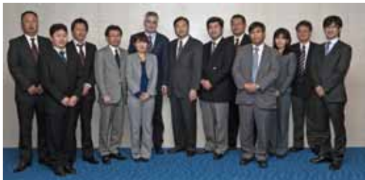
(2010年12月開催のタスクフォースミーティングにて)

また、日本におけるEtherCATの普及活動を推進するため、有志による“タスクフォース”が2009年8月に発足し、現在メンバー6社により、展示会の運営、各種セミナーの開催、技術的課題の解決やサポートなど、EtherCATの認知度・理解度の向上や普及促進のため積極的な活動を展開しています。