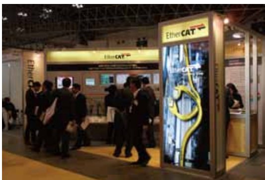
(SEMICON Japan 2010のETGブース)